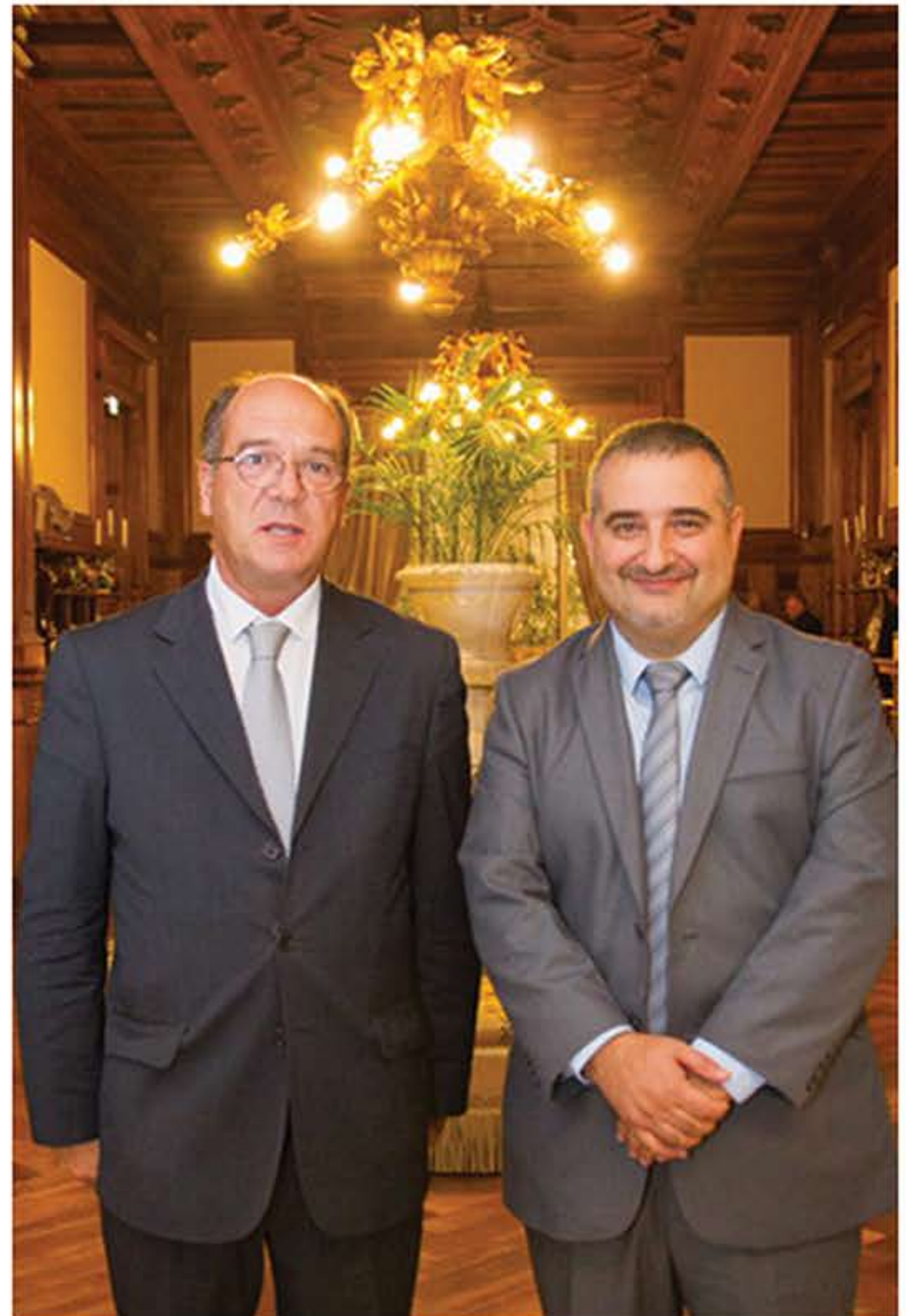
Maire de Cascais, Carlos Carreiras

Une réunion de travail avec le maire de Cascais, Carlos Carreiras, sera organisée pour permettre aux jeunes de venir présenter et défendre leurs propositions afin qu'elles puissent ensuite être soumises aux votes de l'équipe municipale.