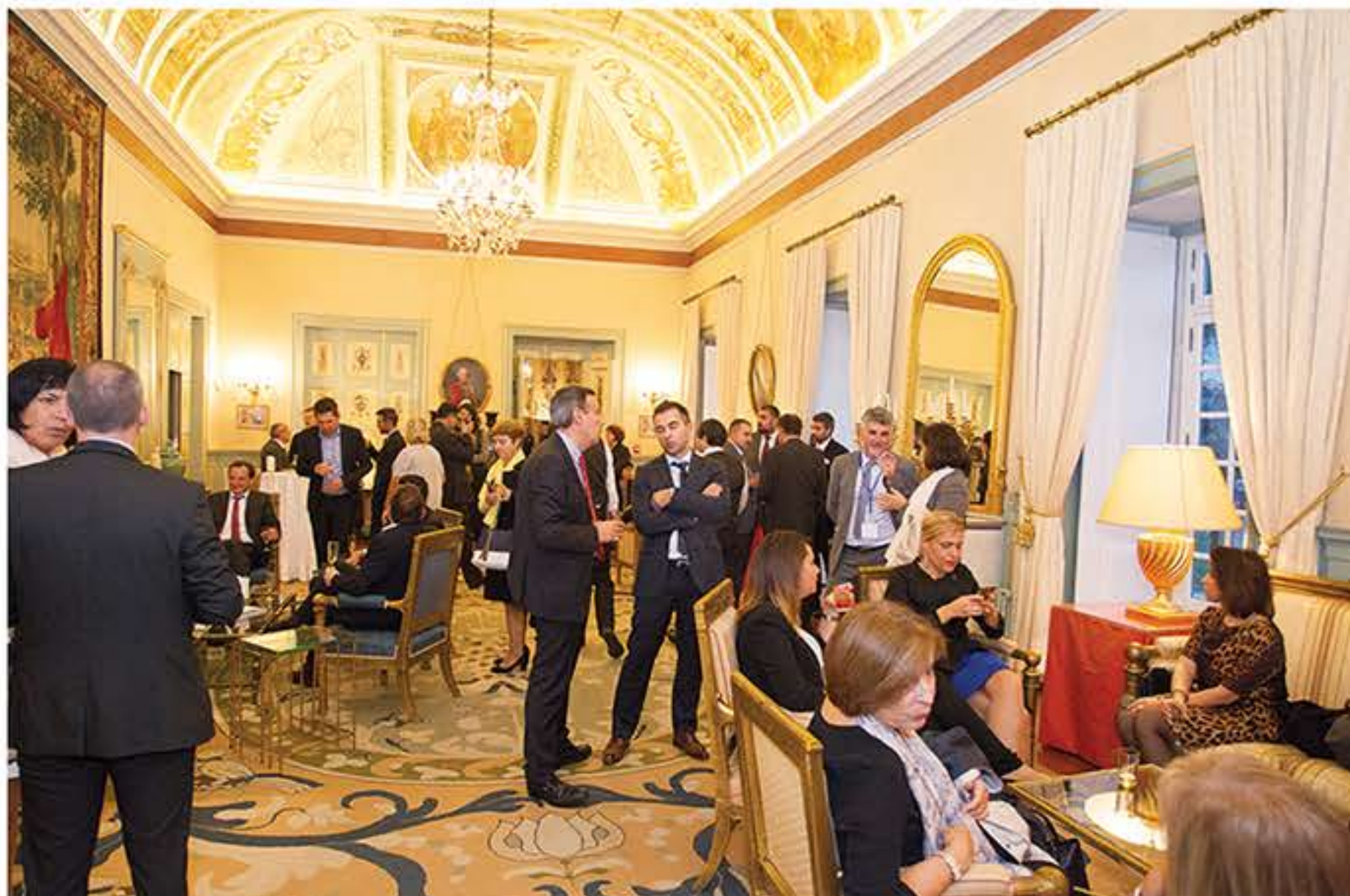
Ambassade de France à Lisbonne

Un voyage d'étude riche en rencontres et en échanges pour la délégation française