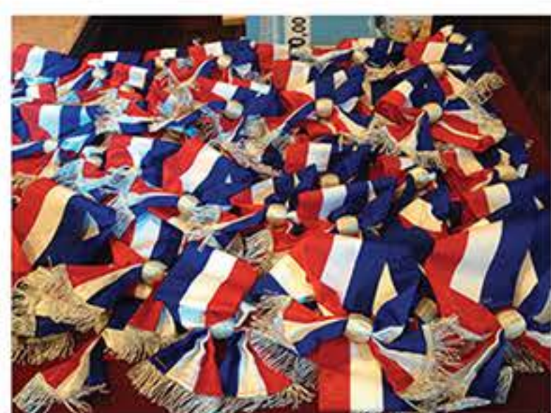
|| Focus sur la citoyenneté p.9