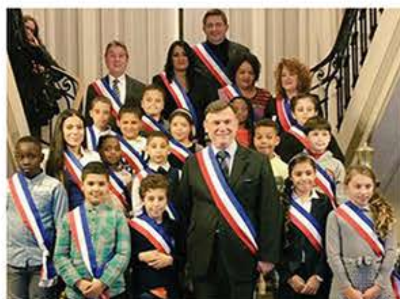
|| Civica s'engage ! p.15