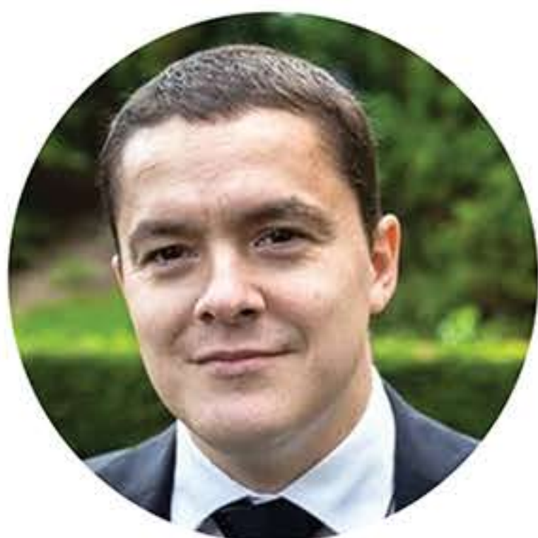
Roméo de Amorim lance un mouvement politique

Le Conseil d'Opinion RTP émet également des avis sur les initiatives législatives touchant la radio et la télévision publique, sur le contrat de concession et la classification des missions de service public.