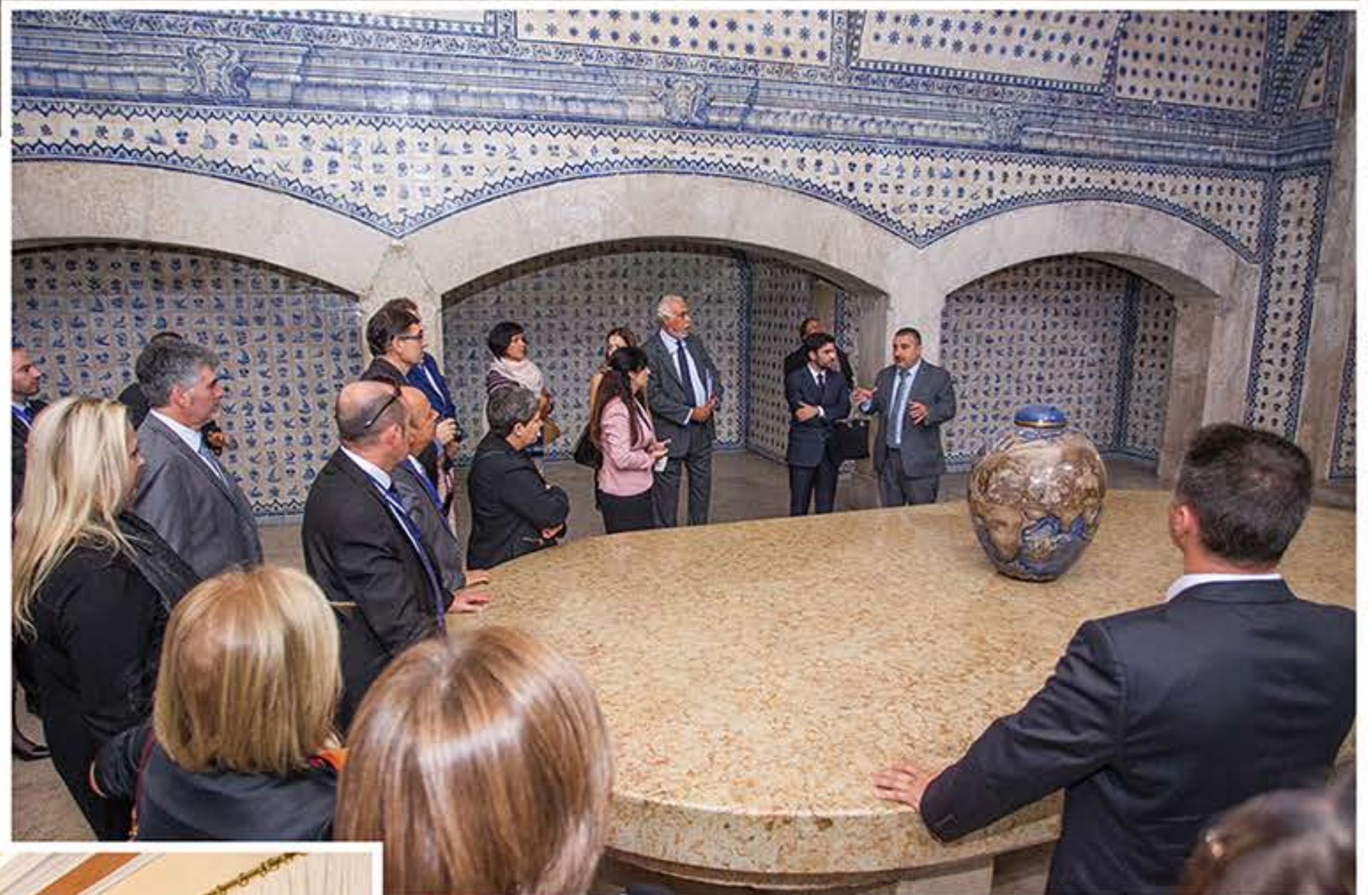
Ministère des Affaires Étrangères du Portugal

Civica à la découverte des institutions portugaises