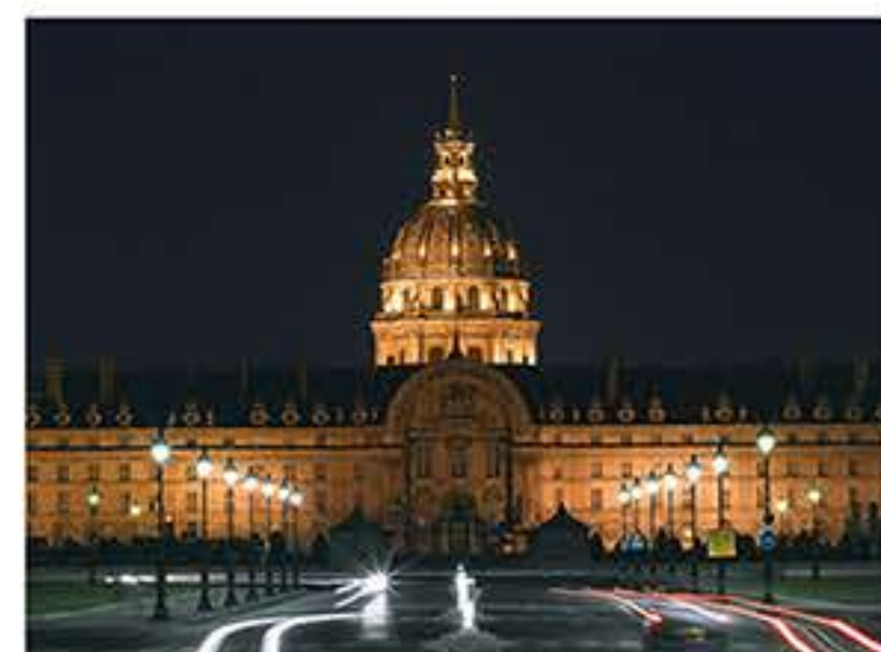
|| Congrès Civica 2017 p.23