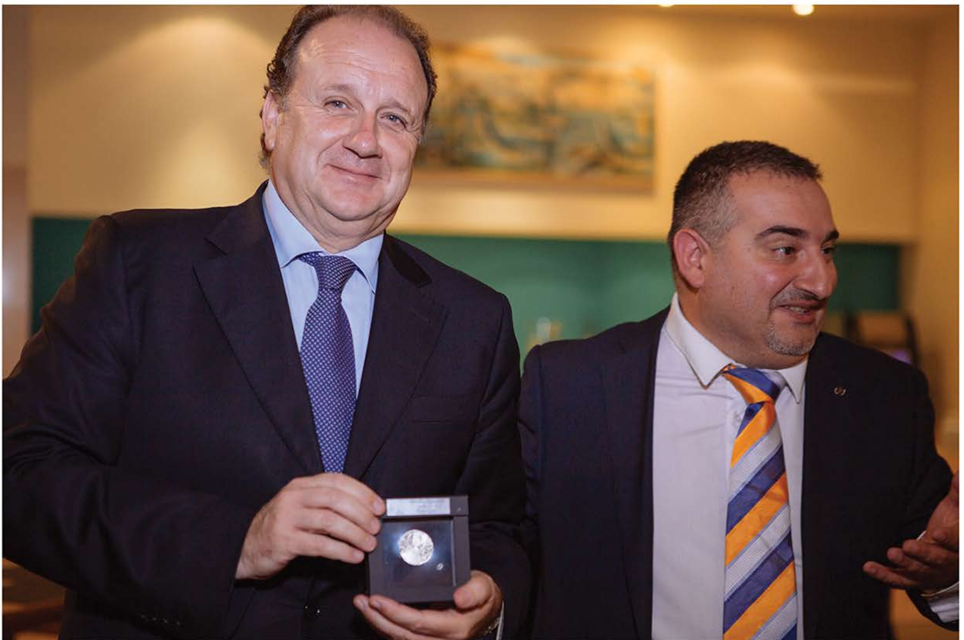
Député Carlos GONÇALVES, Président du groupe d'amitié Portugal-France de l'Assemblée Nationale du Portugal.