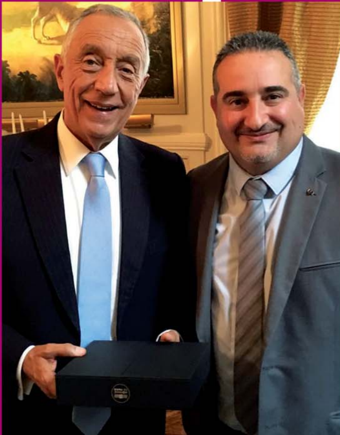
International: Le chef d'Etat, Marcelo Rebelo de Sousa et le Président de CIVICA.