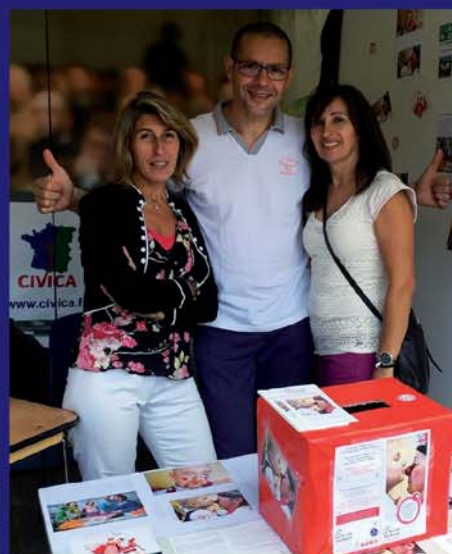
Soutien à l'association Rire médecin et sa drôle de course (juin)