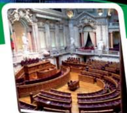
16 Voyage d'étude de CIVICA