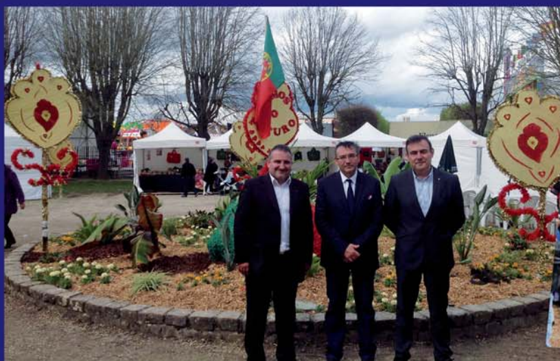
Présence à la 175 e foire de la Saint Parfait à Monterault-Faux-Yonne (avril)