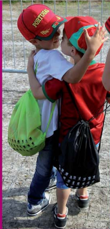
Enfants invités à un entraînement de l'équipe du Portugal dans le cadre de l'Euro 2016 et de la Citoyenneté