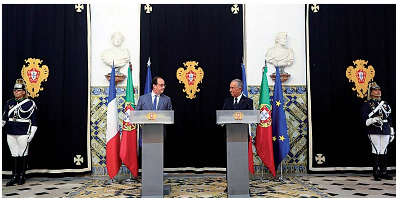
François Hollande au Portugal.

La tragédie de Nice a provoqué l'annulation de la venue d'une délégation pour laquelle un membre de Civica était inscrit.