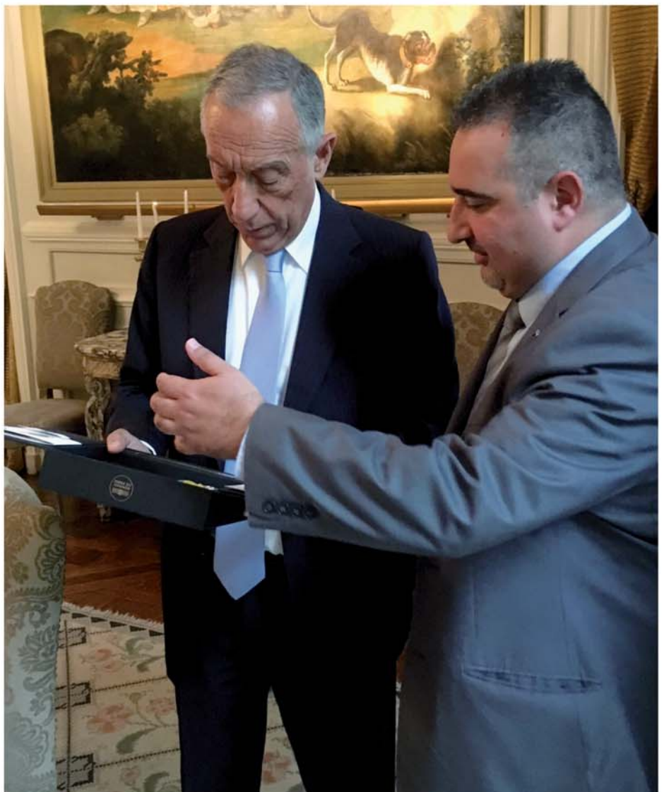
Le Président de la République du Portugal reçoit le coffret de la grande guerre.

« Les portugais venus en France sont les meilleurs d'entre nous, ils sont sortis d'une situation de pauvreté, de difficulté, de douleur, pour partir loin afin de recommencer leur vie, seuls. Les familles sont arrivées après et peu à peu elles ont refait leur vie, avec des emplois difficiles, très difficiles, au début des années 60 et des années 70. » Le Président portugais poursuit son discours, en témoignant une reconnaissance et une admiration envers la communauté portugaise de France. « La France n'oublie pas mais le Portugal l'oublie encore moins. Votre courage, le courage de vos grands-parents, de vos parents, qui se transmettent pour vos enfants, vos petits-enfants. Vous êtes le meilleur de nous tous. Le Président de la République portugaise, au nom de toutes les portugaises et tous les portugais, je vous remercie de votre exemple. » Le Président terminera en français « Vive Paris, Vive la France, Vive le Portugal ». Applaudissements et sourire aux lèvres, les portugais et luso-descendants qui remplissaient la salle n'ont pu qu'approuver le discours entendu.