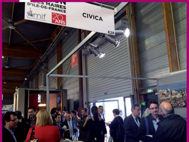
Congressistes sur le Forum CIVICA et la démocratie participative.