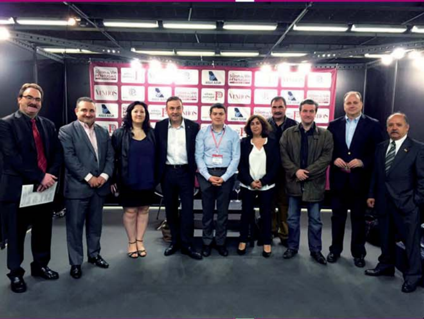
Élus CIVICA au Salon International du Vin Portugais.