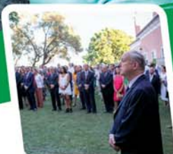
10 Le 14 juillet 2016 fêté à Lisbonne!