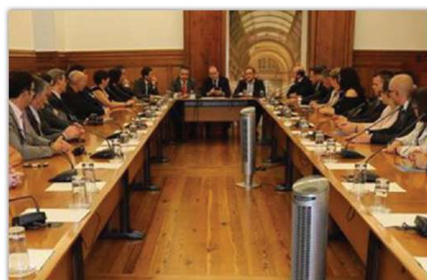
Civica fête ses 18 ans p.7