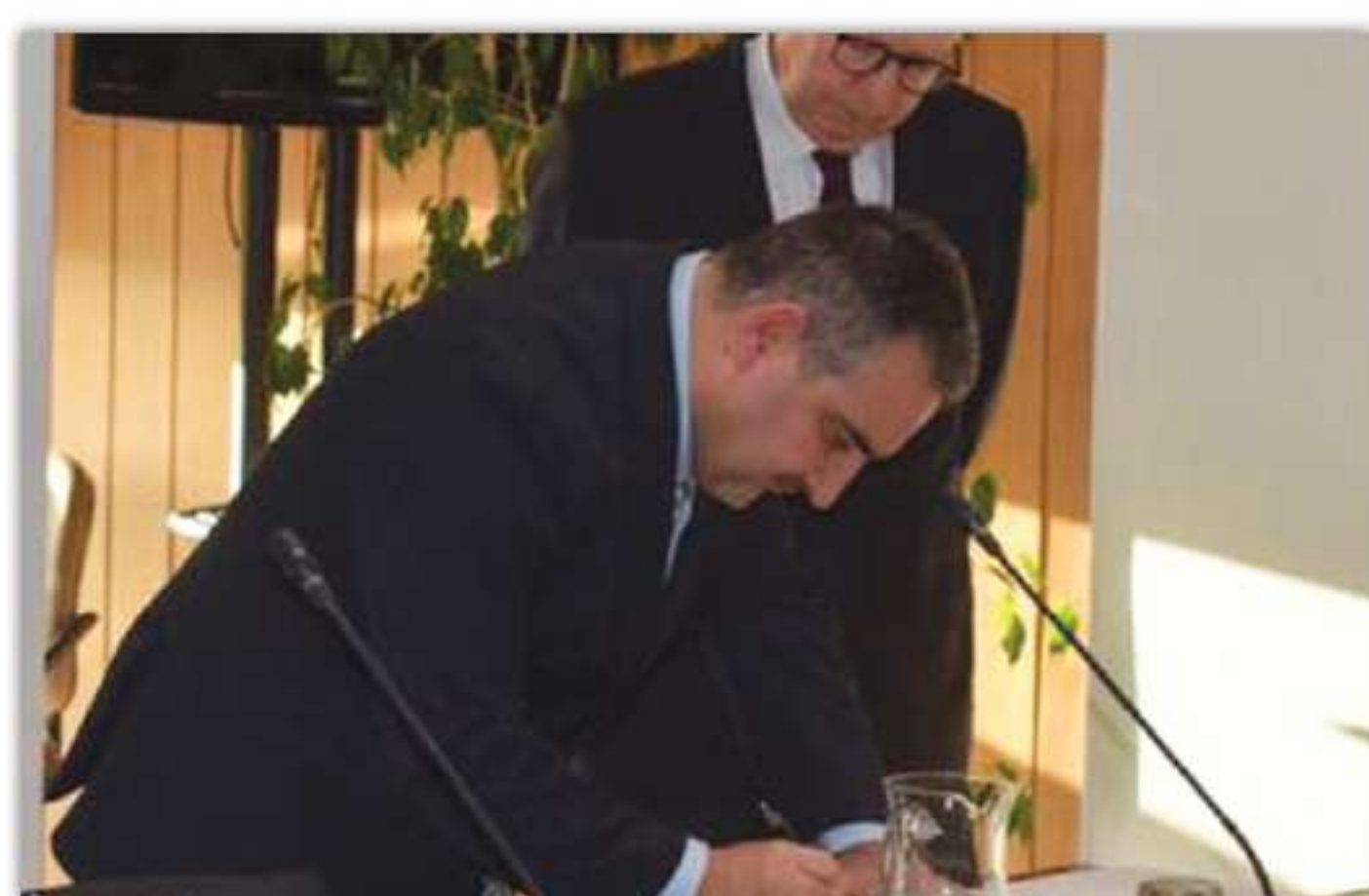
La Cérémonie d'investiture au Conseil Économique et Social p.6